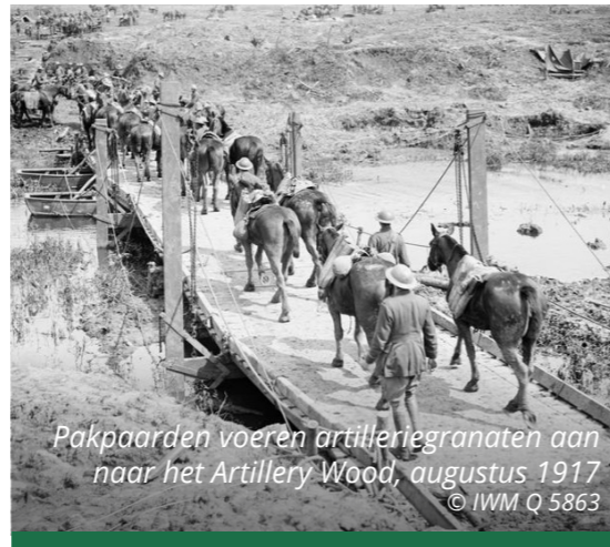
Pakpaarden voeren artilleriegranaten aan naar het Artillery Wood, augustus 1917