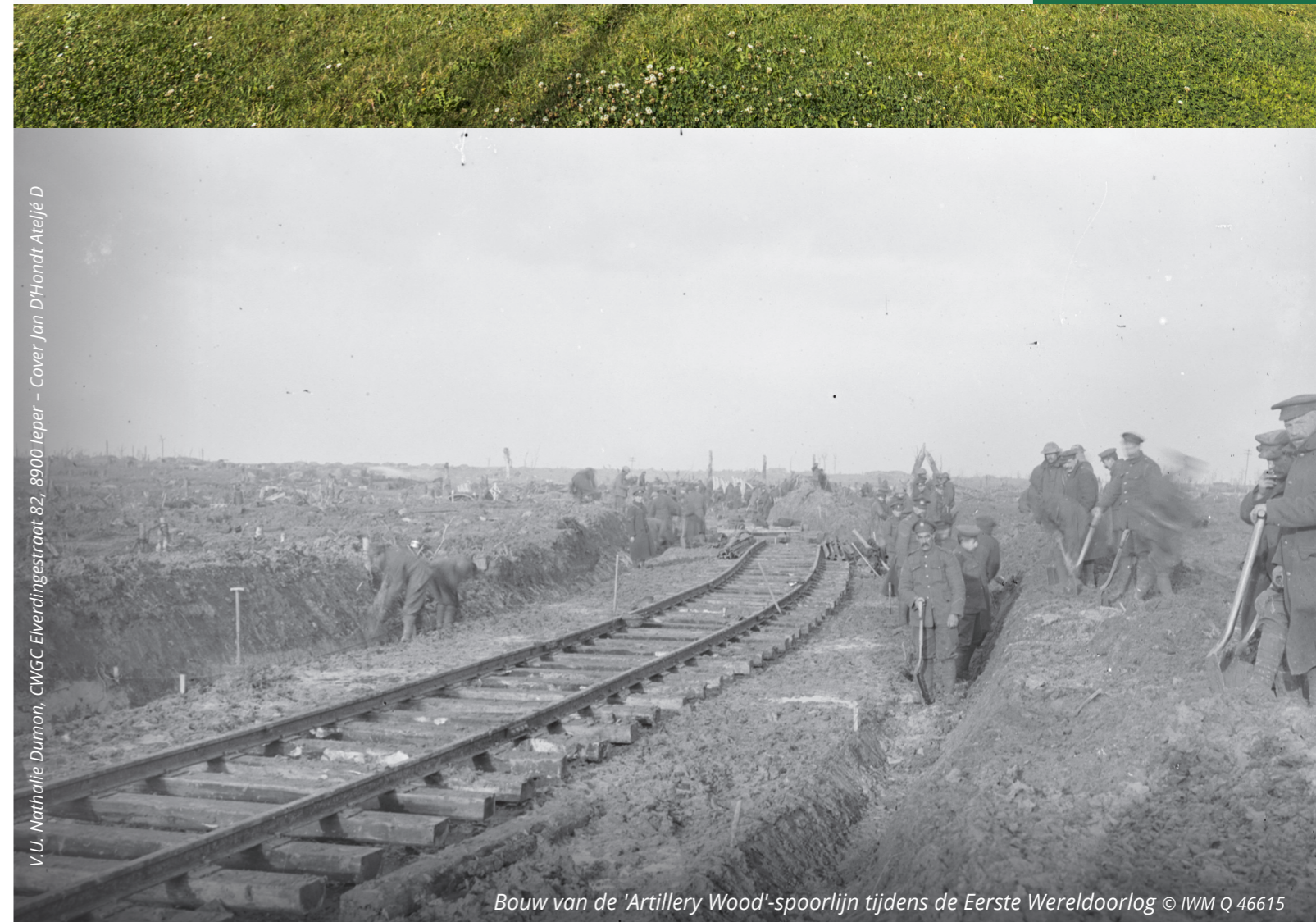
V.U. Nathalie Dumon, CWGC Elverdingestraat 82, 8900 leper - Cover Jan D'Hondt Ateljé D

Voor meer informatie kan je deze code scannen.