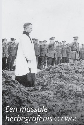
Een massale herbegravenis

Na de oorlog werden vele kleinere begraafplaatsen en individuele geïsoleerde begravingen verplaatst naar de begraafplaatsen die je vandaag kunt bezoeken. Dat proces werd concentratie genoemd. De meeste van de huidige CWGC-begraafplaatsen zijn het resultaat van concentratie, waaronder Perth Cemetery (China Wall). Al die kleine begraafplaatsen, die ondertussen verdwenen zijn, hadden hun eigen namen en verhalen. Sommige begraafplaatsen lagen hier in de buurt, zoals Gordon House Cemetery, dat net verderop bij een boerderij lag. 50 graven werden op die begraafplaats geconcentreerd en vormen nu Perk I, Rij L en Perk II, Rij A. Anderen lagen verder weg, zoals St. Julien Communal Cemetery, waar zes Canadese soldaten werden opgegraven en herbegraven in Perk XIV, Rij B, Graven 3-8. Sommige begraafplaatsen werden door de vijand aangelegd, zoals het Reutel German Military Cemetery. De soldaten van het Gemeenebest die begraven liggen op Reutel stierven als krijgsgevangenen en werden begraven door de Duitsers. Je kunt hun graven zien in Perk IX, Rij A.