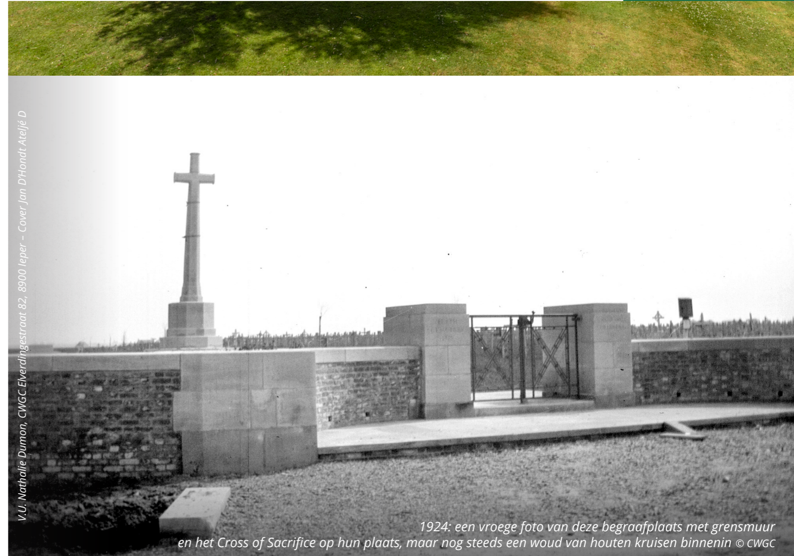
V.U. Nathalie Dumon, CWGC Elverdijngestraat 82, 8900 Ieper - Cover Jan D' Hondt Ateljé D

Voor meer informatie kan je deze code scannen.