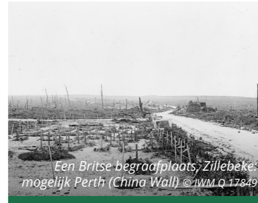
Een Britse begraafplaats, Zillebeke, mogelijk Perth (China Wall)