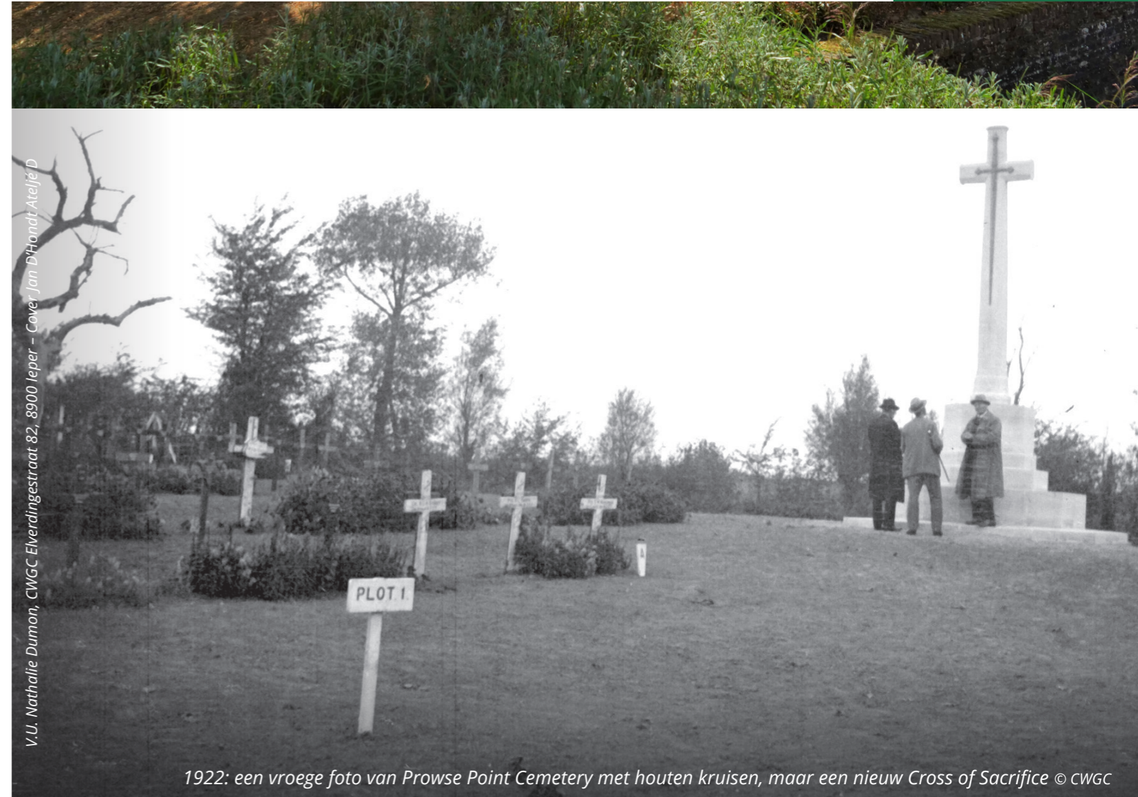
V.U. Nathalie Dumon, CWGC Elverdingestraat 82, 8900 Ieper - Cover Jan D'Handt Atelje D

Voor meer informatie kan je deze code scannen.