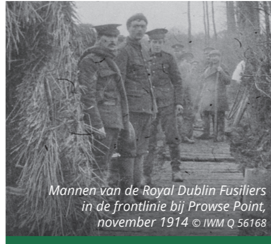
Mannen van de Royal Dublin Fusiliers in de frontlinie bij Prowse Point, november 1914