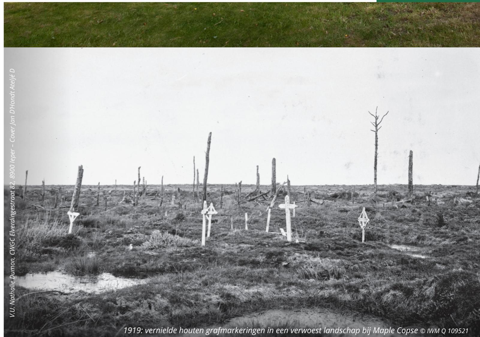
V.U. Nathalie Dumon, CWGC Elverdingestraat 82, 8900 Ieper - Cover Jan D'Hondt Ateljé D