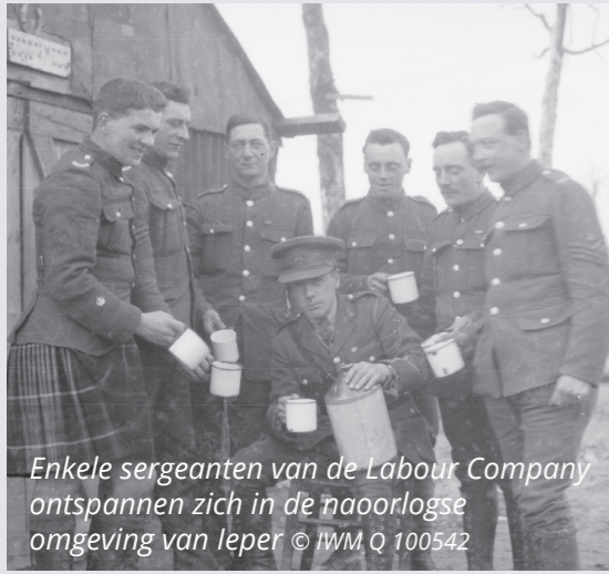
Enkele sergeanten van de Labour Company ontspannen zich in de naoorlogse omgeving van Ieper