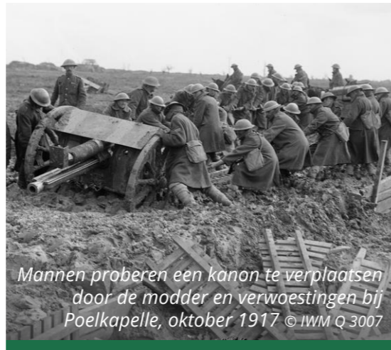
Mannen proberen een kanon te verplaatsen door de modder en verwoestingen bij Poelkapelle, oktober 1917