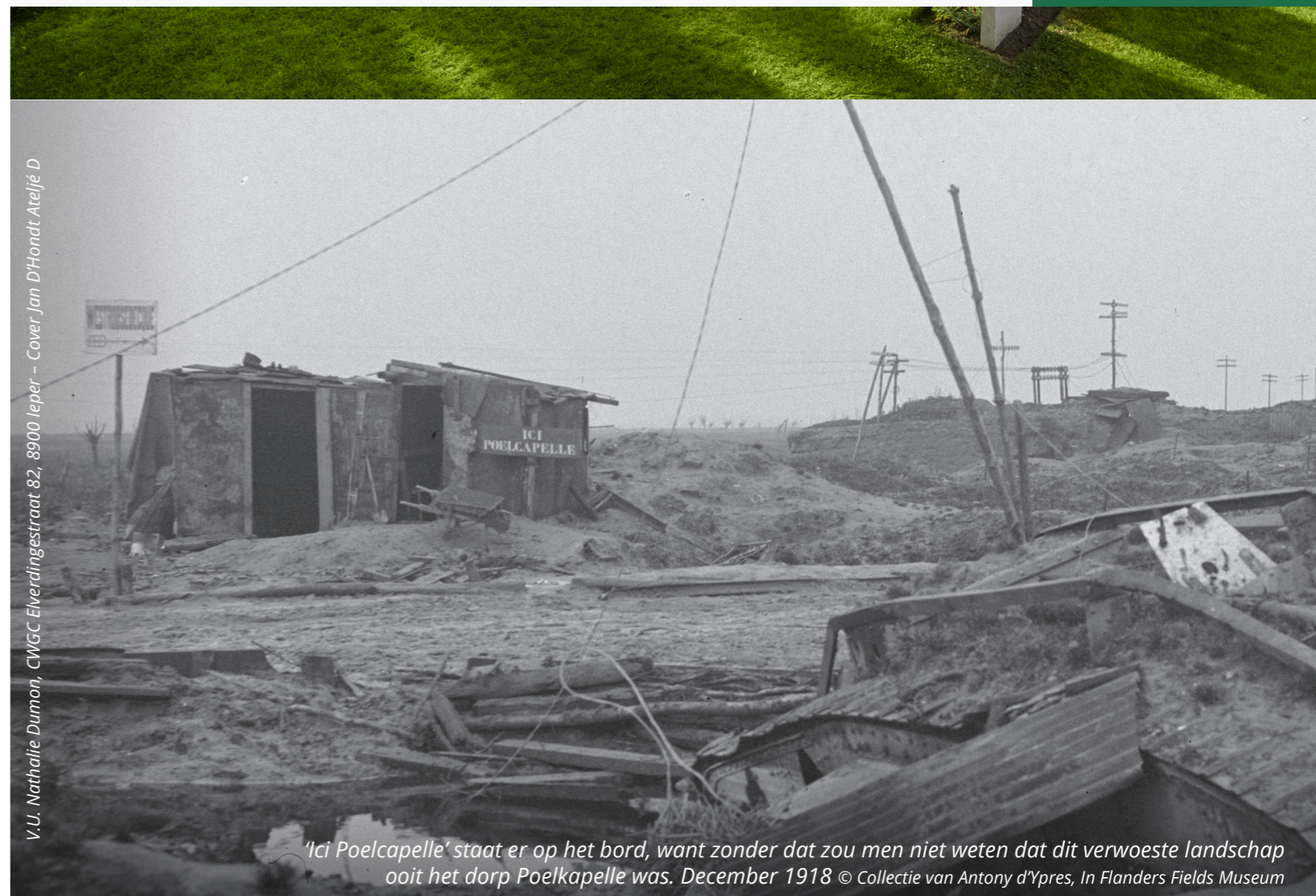
V.U. Nathalie Dumon, CWGC Elverdingestraat 82, 8900 Ieper - Cover Jan D'Hondt Ateljé D

Voor meer informatie kan je deze code scannen.